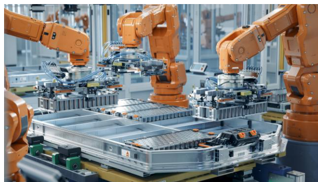
Automatisierte Produktionslinie für EV-Batteriepacks

Kanada gilt als stabiler G7-Industriestandort und baut seine Rolle in der globalen Rohstoff- und Batteriewertschöpfungskette gezielt aus. Durch moderne Freihandelsabkommen wie CETA profitieren deutsche Unternehmen von erleichterten Marktbedingungen und einer engen wirtschaftlichen Verzahnung mit dem nordamerikanischen Raum. Das Land verfolgt eine klare Strategie zum Aufbau einer integrierten Batterie-Wertschöpfungskette – von der Aufbereitung und Veredelung heimischer Rohstoffe bis hin zur Herstellung von Batterien. Zahlreiche Bergbau- und Verarbeitungsbetriebe modernisieren ihre Anlagen und investieren in effizientere, stärker automatisierte und digital vernetzte Technologien. Besonders in der mineralischen Aufbereitung – etwa beim Brechen, Mahlen, Sortieren, Flotieren oder in hydrometallurgischen Prozessen – zeichnet sich ein wachsender Bedarf ab. Mehrere große Vorhaben, unter anderem in Saskatchewan, prüfen und implementieren zunehmend