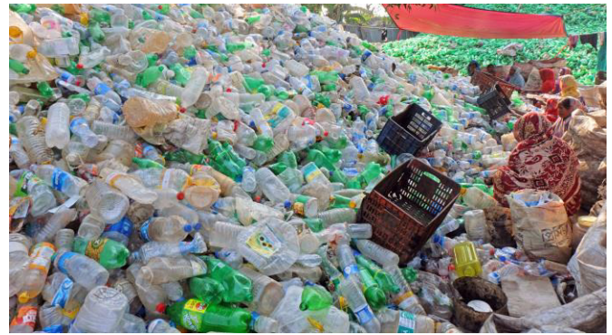
Menschen bei der Entsorgung von Plastikflaschen in der Stadt Chittagong, Bangladesch